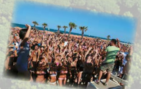
Feste sulla spiaggia Parties on the beach