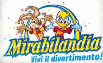
A soli 15 minuti da Mirabilandia, uno dei parchi divertimento più belli e divertenti d'Europa Only 15 min. from Mirabilandia, one of the best and most amusing fun parks all over Europe