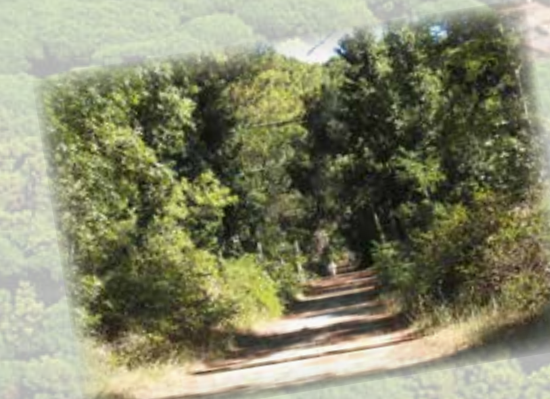
La pineta, ideale per mantenersi in forma (0,00 km) The pinewood, ideal for jogging