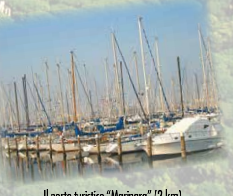
Il porto turistico "Marinara" (2 km) The port for tourists "Marinara"