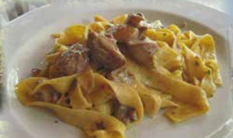
Le specialità gastronomiche Gastronomical traditions