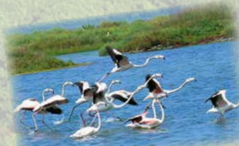
Birdwatching nel parco del Delta del Po Birdwatching in the Po Delta Park