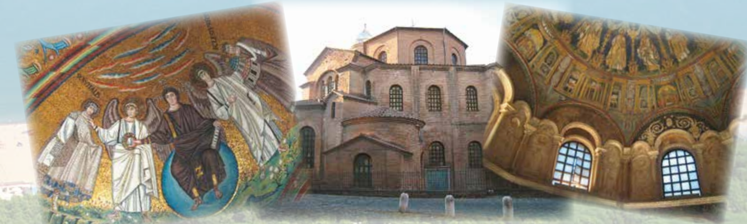
Ravenna, città d'arte e cultura bizantina, dichiarata dall'Unesco Patrimonio dell'Umanità (8 km) Ravenna, famous for its byzantine treasures, a Unesco World heritage site