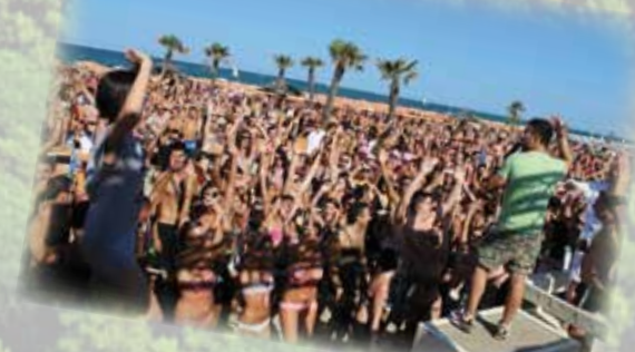
Feste sulla spiaggia Parties on the beach