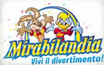
A soli 15 min da Mirabilandia, uno dei parchi divertimento più belli e divertenti d'Europa Only 15 min. from Mirabilandia, one of the best and most amusing fun parks all over Europe