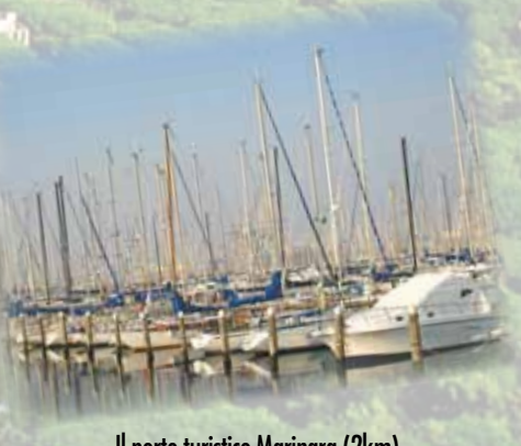
Il porto turistico Marinara (2km) The port for tourists Marinara