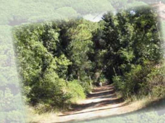
La pineta, ideale per mantenersi in forma (0,00 km) The pinewood, ideal for jogging