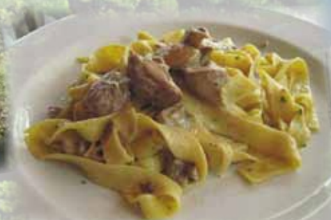
Le specialità gastronomiche Gastronomical traditions