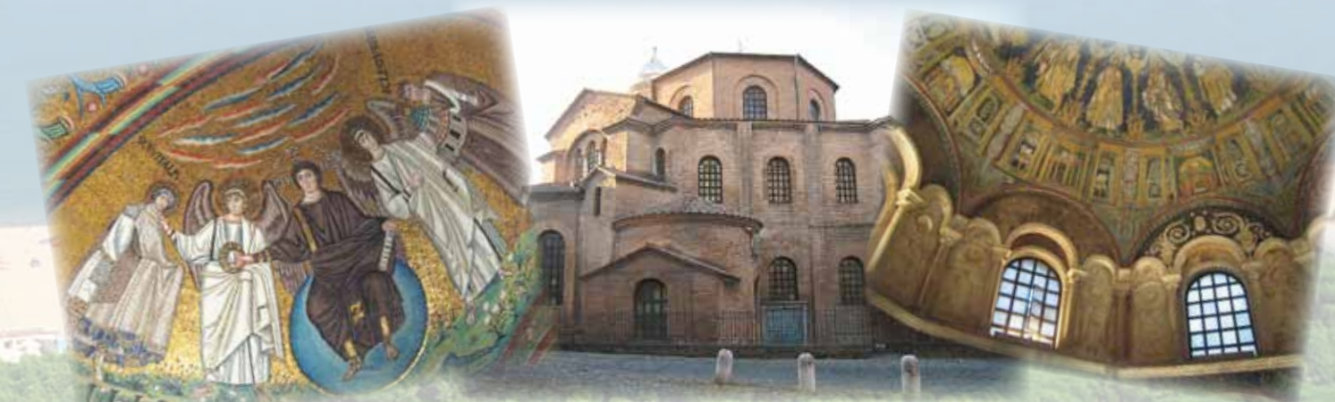
A 8 km da Ravenna, città d'arte e cultura bizantina, dichiarata dall'Unesco Patrimonio dell'Umanità Only 8 km. from Ravenna, famous for its byzantine treasures, a Unesco World heritage site