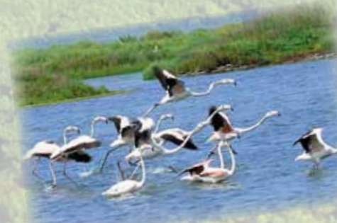
Birdwatching nel parco del Delta del Po Birdwatching in the Po Delta Park