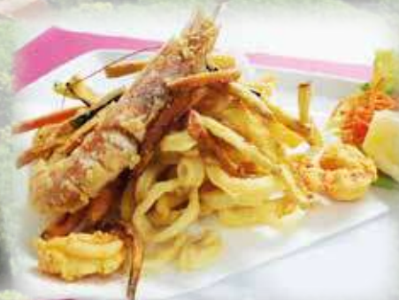
Le specialità gastronomiche Gastronomical traditions