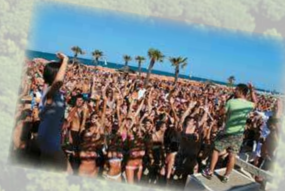
Feste sulla spiaggia Parties on the beach