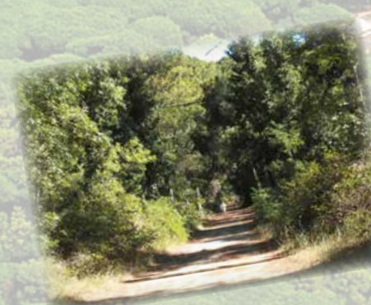
La pineta, ideale per mantenersi in forma (0,00 km) The pinewood, ideal for jogging