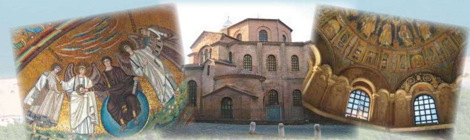
Ravenna, città d'arte e cultura bizantina, dichiarata dall'Unesco Patrimonio dell'Umanità (8 km) Ravenna, famous for its byzantine treasures, a Unesco World heritage site