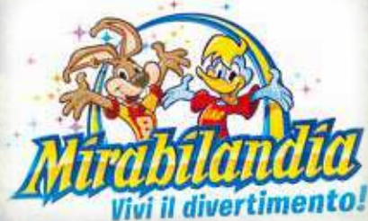
A soli 15 minuti da Mirabilandia, uno dei parchi divertimento più belli e divertenti d'Europa Just 15 min. far from Mirabilandia, one of the best and most amusing fun parks all over Europe