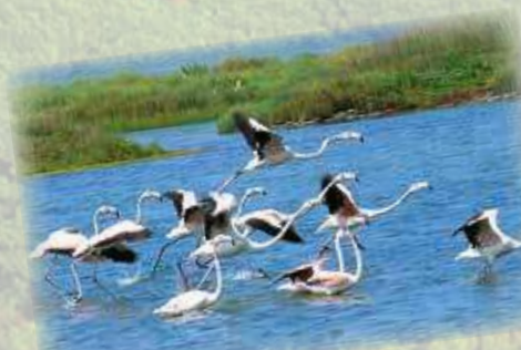
Birdwatching nel parco del Delta del Po Birdwatching in the Po Delta Park