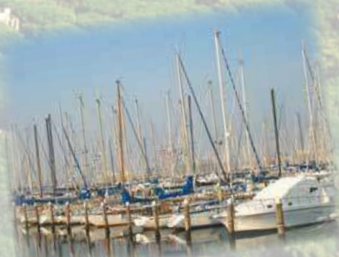
Il porto turistico "Marinara" (2 km) The port for tourists "Marinara"