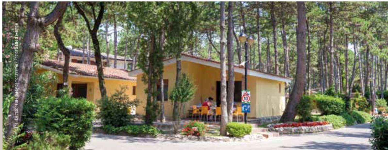
The illustrations are purely demonstrative - Photos à titre d'exemple

Les prix sont pour un minimum de trois nuits, pour les séjours de moins de trois nuits, un supplément de 20% est appliqué. Du 08/06 au 14/09 les réservations sont seulement sur une base hebdomadaire.