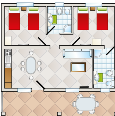
Table en plastique avec 6 chaises, éclairage extérieur, 2x chaises longues, parking pour 2 voitures.