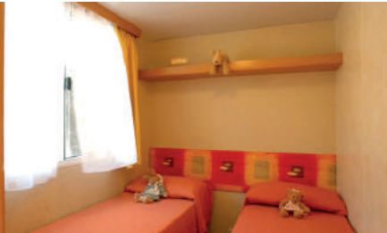
Mobilhome Mod. B