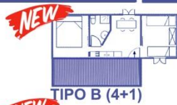
TIPO B (4+1)