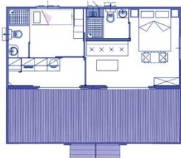
TIPO F Ikhaya (4+1)