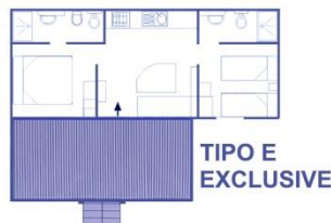
TIPO E EXCLUSIVE