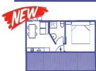
TIPO A (2+1)