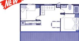
TIPO C EXTRA (4+1)