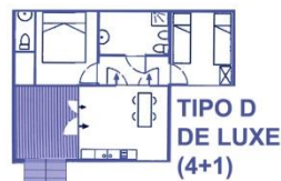
TIPO D DE LUXE (4+1)