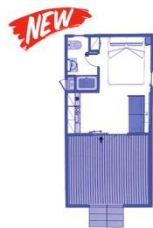
TIPO A PLUS (2+1)